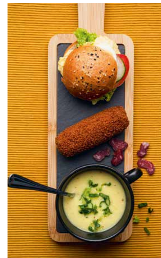
▲ Een twaalf-uurtje biedt alles in één.

De specifieke mogelijkheden en arrangementen zijn te vinden op onze website.